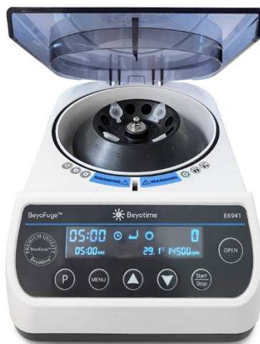
图1. 碧云天BeyoFuge™数字式微型高速离心机(14500rpm) (E6941)示意图。